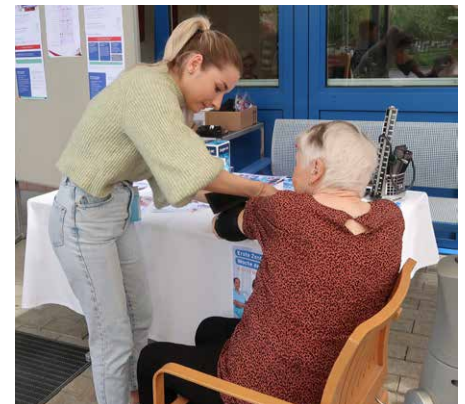
Am Infostand für Gesundheitsberufe.