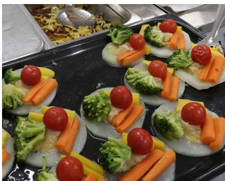
Die Eiche-Küche verwöhnte.