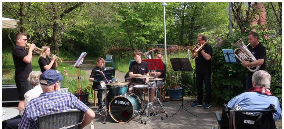
Die «Brasselbande» sorgte für Stimmung.