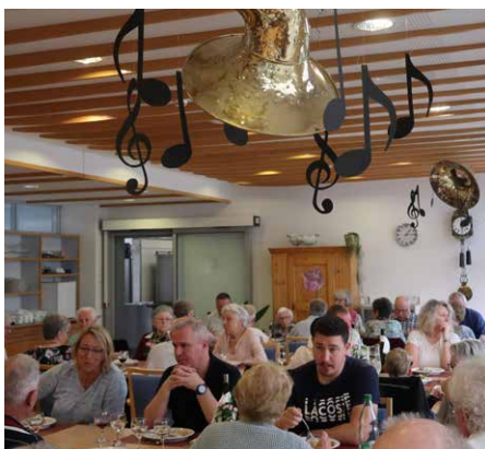
Rund 150 Personen kamen ans Eiche-Fäscht.